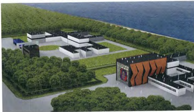
Te realiseren HUMANIMAL gebouw waar life sciences-ondernemers zich kunnen vestigen