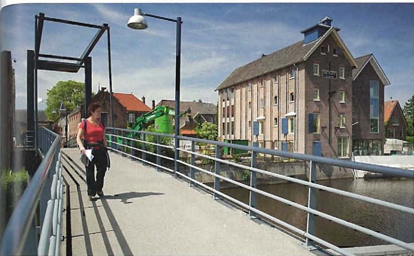
Voormalig pakhuis De Vlijt aan de binnenhaven.