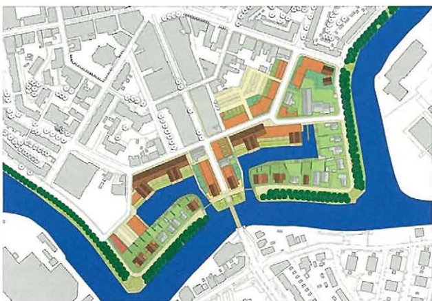
De uitwerking voor het Bogas-terrein.