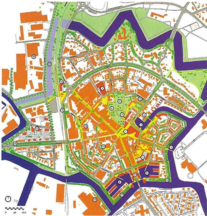
Het Wensbeeld van Khandekar uit 2001. Het niet-gebouwde stadhuis op de Markt heeft nummer 1, de Hof van Coevorden staat ter hoogte van nummer 2. Nummer 5 is de Weeshuisweide, 9 het Bogas-terrein en 16 Holwert-Zuid.