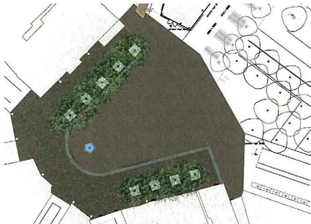
Het herinrichtingsplan voor De Markt. De parkeerplaats onder de platanen (rechts) is buiten het ontwerp gelaten.