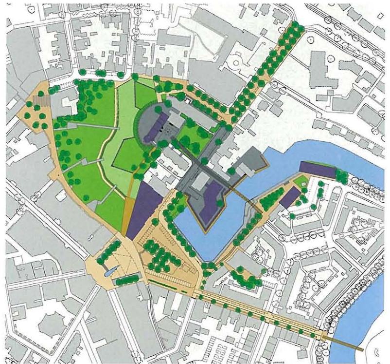
De uitwerking voor het deelgebied Markt-Haven.