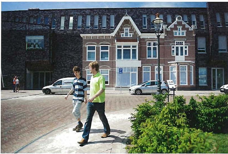
Voorzijde van de Hof van Coevorden (Architectenbureau RAU).