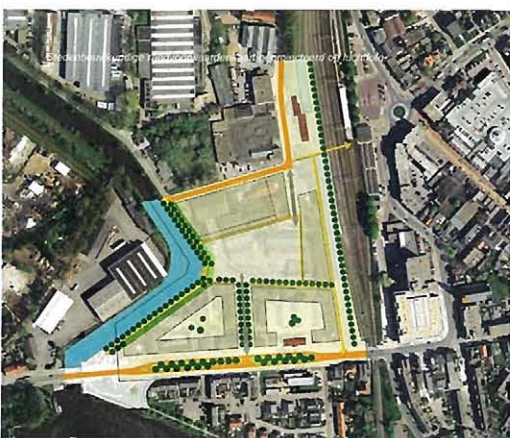
De uitwerking voor Holwert-Zuid.