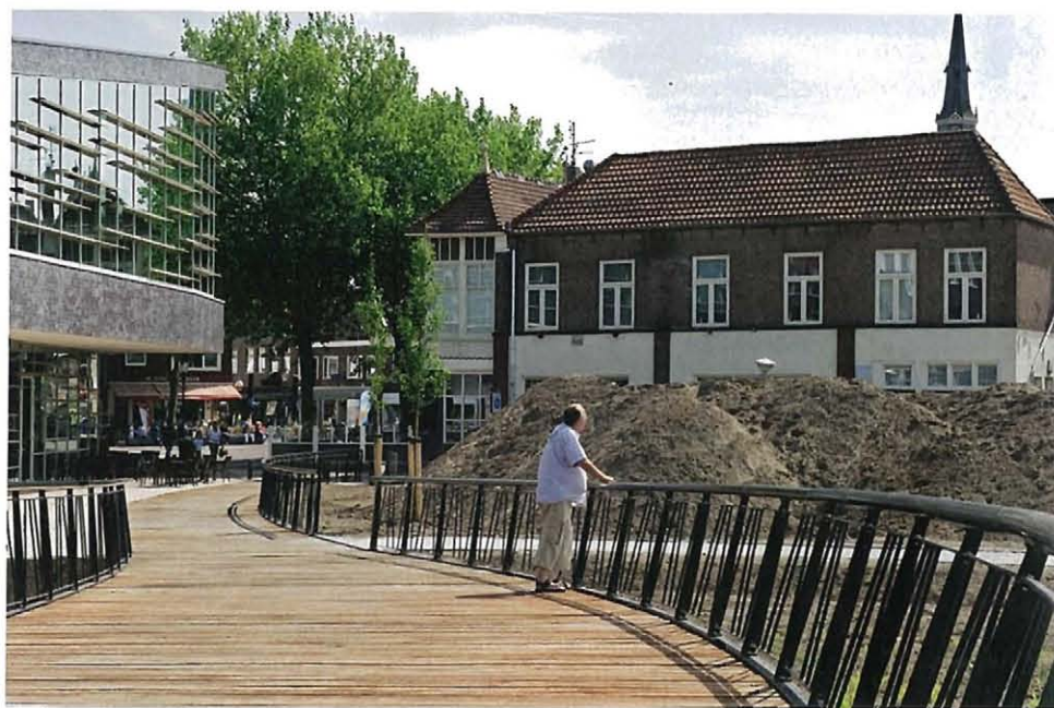
De verhoogde loper achter de Hof van Coevorden, met zicht op de Markt.

Onderwerp Centrumplan Coevorden Ontwerp BDP.khandekar (Shyam Khandekar, Pauline Dinjens, Nynke Jelles, Guido Nas) Opdrachtgever gemeente Coevorden Ontwerp 2001 (wensbeeld), 2002 - 2005 (gebiedsuitwerkingen Markt/Haven, Bogas-terrein en Holwert-Zuid en Catalogus Openbare Ruimte) Uitvoering sinds 2005