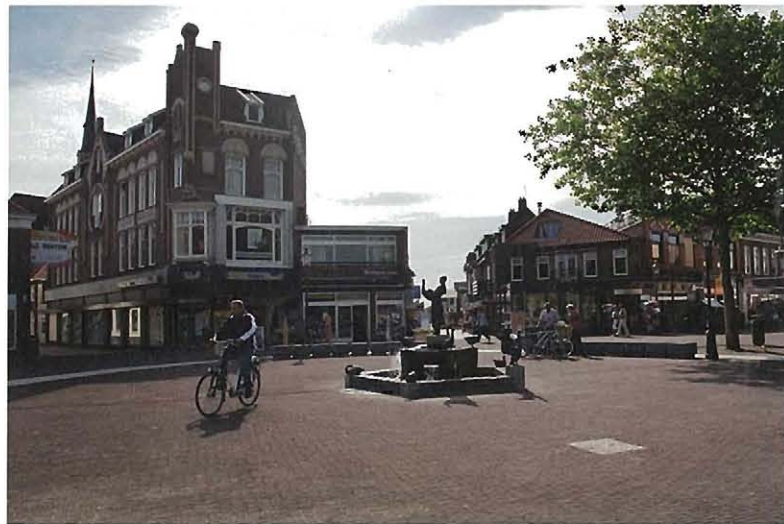
Het kleinschalige en heringerichte dorpsplein met vier regelmatige radiaalstraten.

Khandekar kreeg niet de kans om iets te doen aan de onlogische vorm van de Markt. Deze bestaat uit een dorpsplein en een daaraan vastgeplakte parkeervlakte, die funest is voor de intimiteit van het dorpsplein. Zes radiaalstraten komen uit op de Markt. Slechts vier daarvan benaderen de symmetrie die hoort bij een in de renaissance ontworpen stad. Deze vier lopen door het burgerlijke gedeelte van de vesting, dat van meet af aan dichtbebouwd was. De andere twee, plus het parkeerplein, behoren tot het militaire deel dat veel onregelmatiger is aangelegd. Aanvankelijk was het idee om het nieuwe stadhuis op het parkeerterrein te bouwen, zodat er een beschermt plein zou ontstaan met zicht- en looplijnen naar een aantal bijzondere bestemmingen in het militaire deel: het kasteel, de binnenhaven (ooit deel van de kasteelgracht), het bastionpark. De Raad van State blokkeerde dit plan vanwege de 'hoge archeologische verwachtingswaarde' van de bodem onder de Markt. Intimiteit moet nu komen van de bestaande platanengroep tussen de geparkeerde auto's en de opstelling van het nieuwe zitmeubilair, in een halve cirkel met de rug naar de burgerlijke stad. Maar het scheefgegroeide markt-