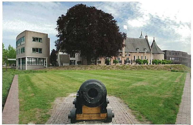
De heringerichte Weeshuisweide.