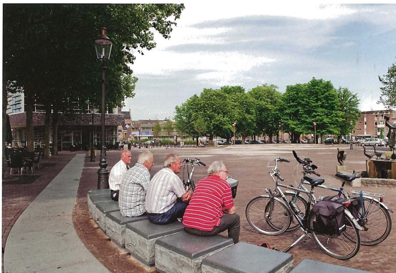
Het parkeerplein mocht niet worden bebouwd, intimiteit moet komen van de platanen.

Hoezeer stedenbouw een vak is van geduld en continuïteit, merkte de gemeente Coevorden. Sinds 1999 is de gemeente in touw om de historische vestingstad allure, publiek en economisch vermogen terug te laten winnen. Tot die tijd was zwaar ingeteerd op het historisch kapitaal van de stad. Ooit was Coevorden een volmaakte militaire vesting, een van de weinige in Nederland, rond 1700 ontworpen door de legendarische vestingbouwer Menno van Coehoorn. Maar sinds de ontmanteling van de vesting in 1870 kwam daar de klad in. De binnen- en buitensingel zijn deels gedempt en vormen nu samen een niet helemaal symmetrische enkele gracht, die de binnenstad voor driekwart omsluit. Voor architectuur was weinig aandacht: karakterloze panden uit de twintigste eeuw staan soms pal naast de grote monumenten uit de glorieertijd. En overal staan auto's. Zo'n binnenstad nodigt niet erg uit tot investeren, met leegstand tot gevolg. Maar de binnenstad is wel wezenlijk voor de woon- en leefkwaliteit van Coevor-